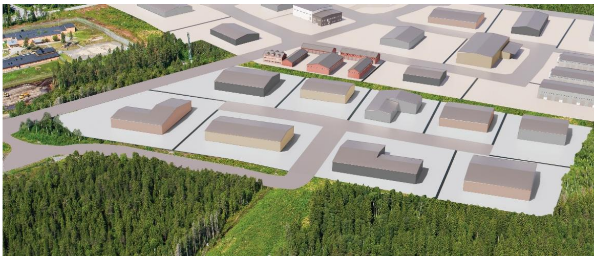
Figur 5. Illustration för byggnation av Östra Ersboda etapp 2. OBS! Illustrationen ska ses som en helhet och inte som en skiss för varje enskild fastighet.