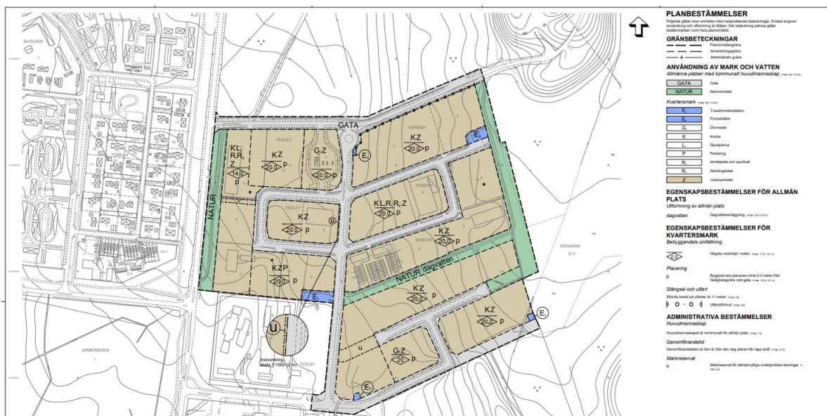
Figur 4. Detaljplanen för etapp 1 och 2.

Eftersom detta område ligger intill den norra entrén till Umeå är utformningen av platser och byggnader av stor vikt.