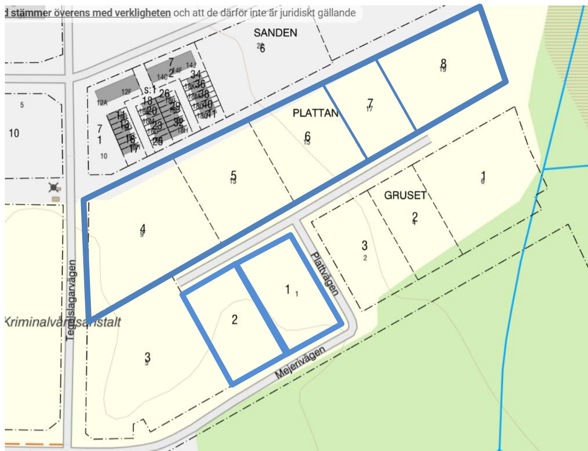
Figur 3. Blå ram visar sålda eller reserverade fastigheter.

Ettapp 2 planeras preliminärt delas upp på 11 fastigheter om ca 3 000–10 000 kvm vardera.