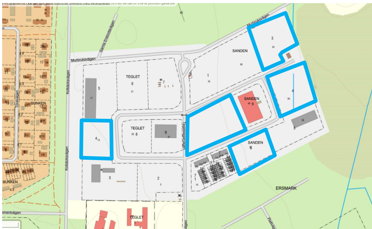
Figur 3. Karta över fastighetsindelning. Fastigheter markerade med blå kantlinje är tillgängliga. Övriga fastigheter är reserverade, köpta eller bebyggda.